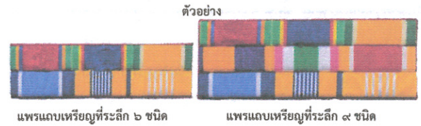
แพรแถบเหรียญที่ระลึก ๖ ชนิด

จากตารางด้านซ้าย หากเกิดปี พ.ศ. 2527 เราจะมีสิทธิติดเหรียญที่ระลึก/แพรแถบย่อเหรียญที่ระลึก ตั้งแต่ปี พ.ศ. 2527 คือ เหรียญที่ระลึก/แพรแถบย่อเหรียญที่ระลึกสมเด็จพระศรีนครินทราบรมราชชนนี 84 พรรษา เรียงลงมาจนถึงปี พ.ศ. 2555 คือ เหรียญที่ระลึก/แพรแถบย่อเหรียญที่ระลึกสมเด็จพระบรมโอรสาธิราชฯ ครบ 5 รอบ นับรวมกันได้ 10 เหรียญที่ระลึก/แพรแถบย่อเหรียญที่ระลึก